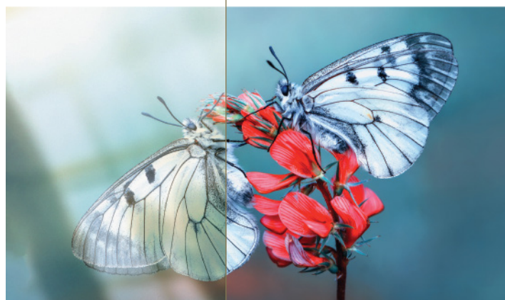
Normales Glas Artglass AR 99 Water White

Erkunden Sie die Optionen und kontaktieren Sie einen Vertreter in Ihrer Nähe